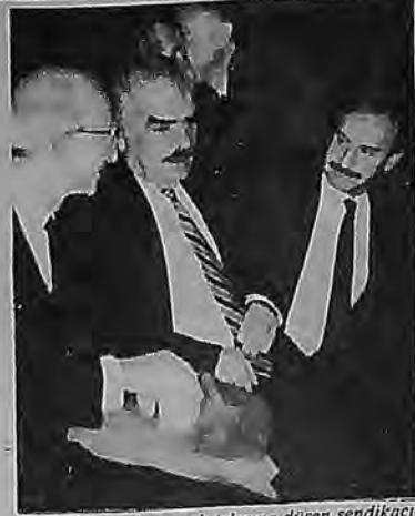
• Koltuklarını korumak telaşına düşen sendikacılar arasında DYP-SHP ittifakı ön plana çıktı.

Bu durum sendika genel kurullarında genel olarak SHP-DYP ittifaklaşması şeklinde ortaya çıktı. Türk-İş genel kuruluna doğru bu ittifak, içine iktidar yanlılarını da alarak işçi sınıfını "devlet sendikası" içinde denetim altında tutmak, gelişebilecek sendikal muhale-