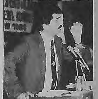
Genel Kurulun 3. günü konuşan delegeler ise, Şeker-İş ve Türk-İş'in geçmiş dönem politika ve "zan'larına" ilişkin daha bir açıklık getiriyorlardı.

89 Türkiye'sinde "neticede herkesin malumu" olan olaylar, vakti zamanında Şeker-İş yöneticileri tarafından, daha başka olarak "zannetilir"miş.