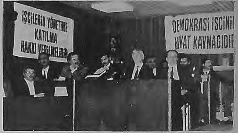
Şeker-İş Sendikası 13. Genel Kurulu yapıldı

Bugün Basın Yayın Y.O.'da yaşananlar önmütüzdeki yaşayacağımız sıcak günlerin ön habercisidir. Olaylara duyarsız kalmak ileride yaratılacak ölümlü mangelana davetiye çıkarmaktır. Tüm halk güçleri, devrimciler, ilericiler, anti-faşistler, aydınlar olaylara duyarlı olmalı Maraş'ları, Çorum'ları yaratılanla ülkemizin bilinciyile faşizmin teşhiriyapılmalı ve bu doğrultuda tüm halk güçleri kesinlikle tavır almalıdır.