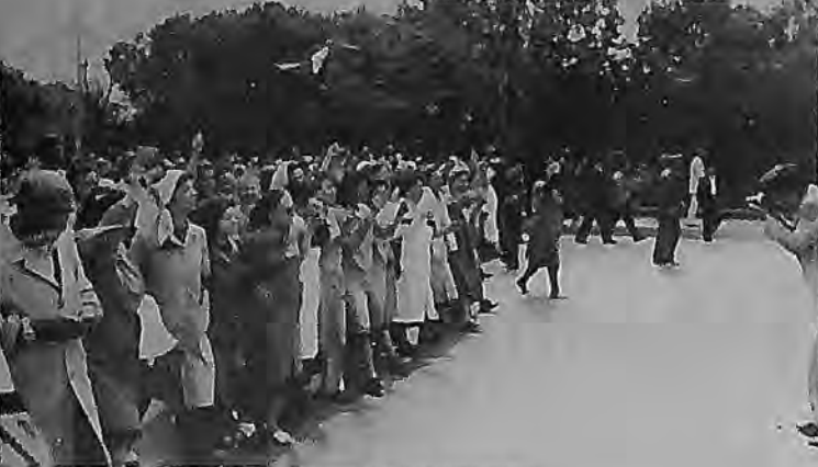
• Mart-Nisan eylemleri sendikal yönetimleri oldukça ürktüştü.